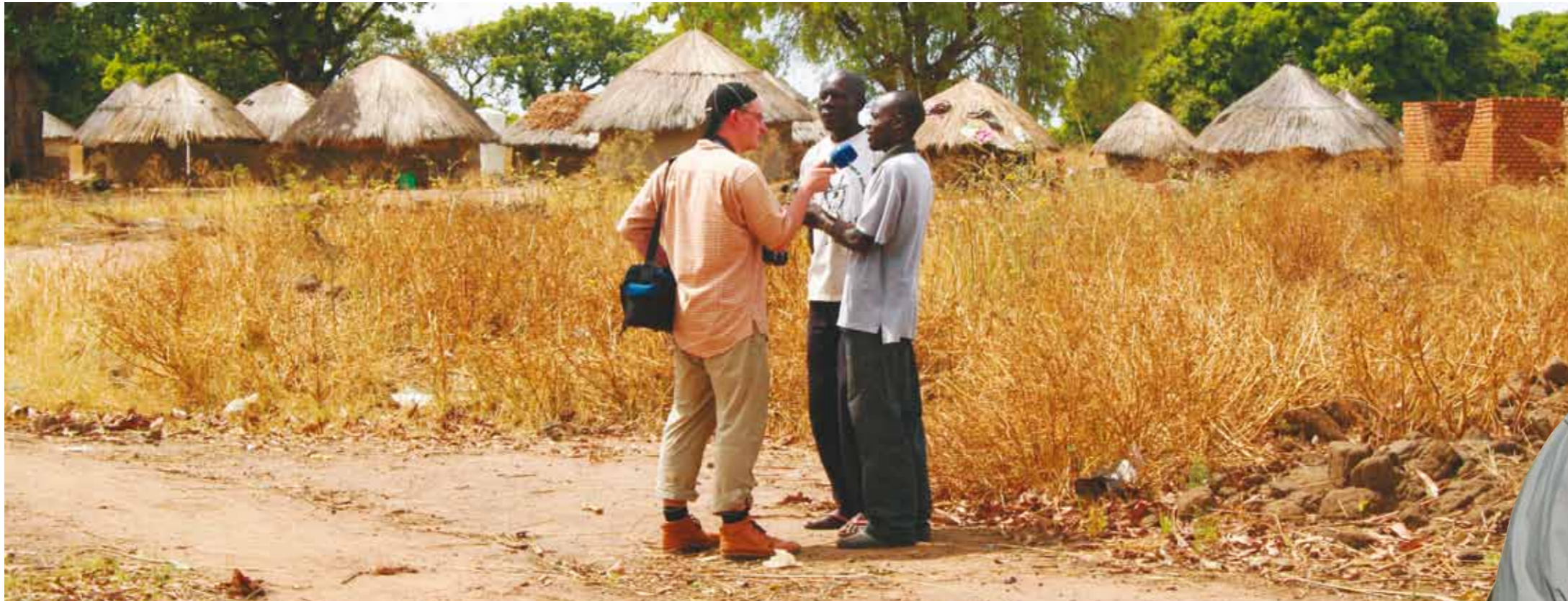
MDR-Interview in Uganda (oben) Fotojournalismus auf Haiti (rechts)