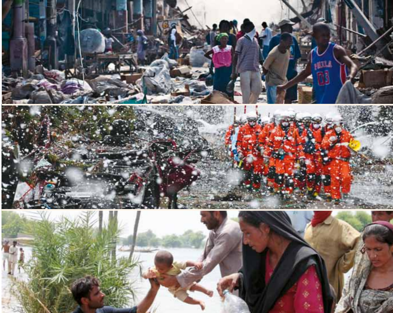
Erdbeben in Haiti, Tsunami in Japan, Flutkatastrophe in Pakistan (von oben)

humanitären Katastrophen ein Bedürfnis der Zuschauer gibt zu helfen, und wir wollen sie in solchen Fällen nicht allein lassen, sondern ihnen Orientierung geben – als Angebot.